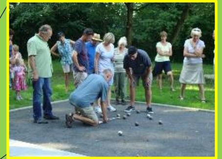
Boule - Anlage