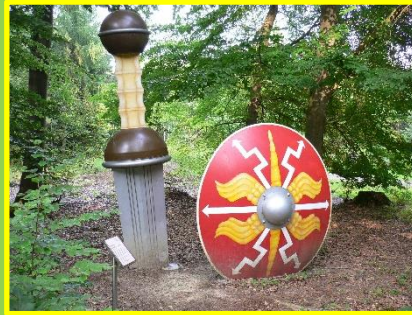
Schwert und Schild