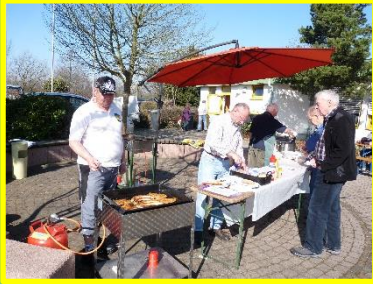
Grillen an Start & Ziel